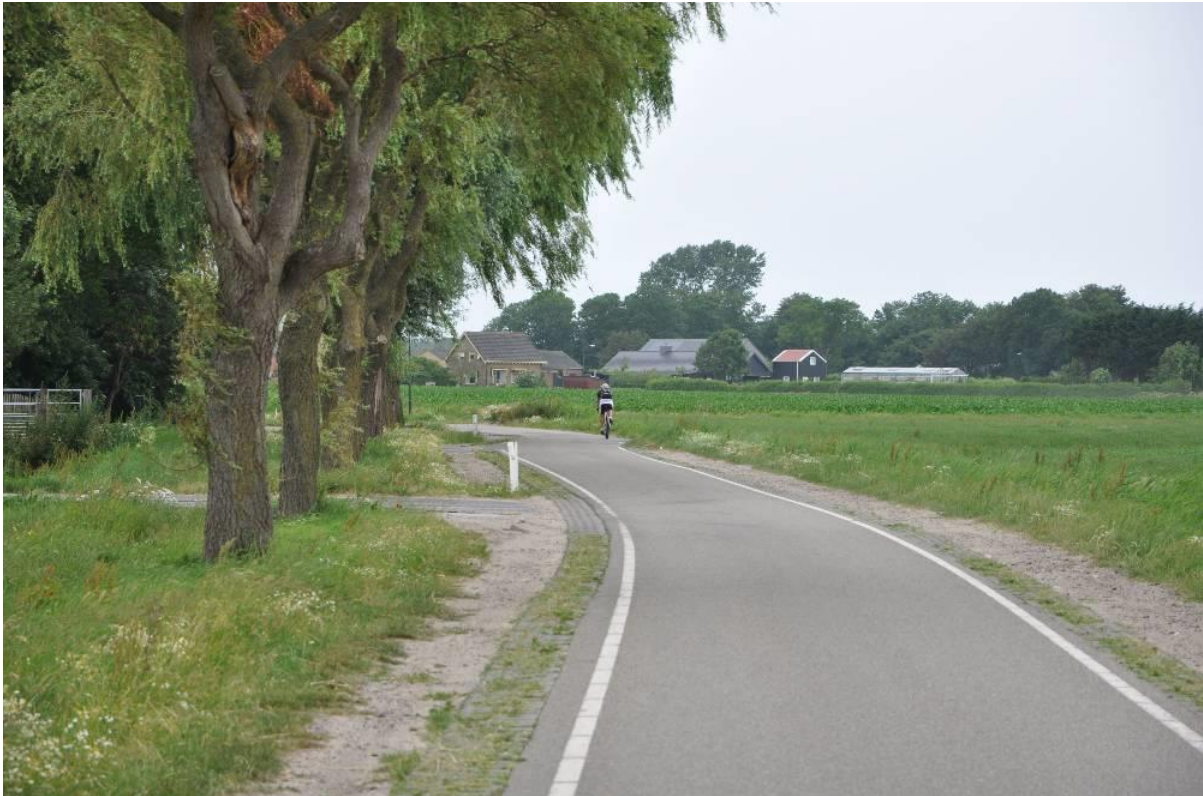
De Zanddijk tussen Bakkum en Limmen.

Die monniken steken in de 8e eeuw vanuit Engeland en Ierland de Noordzee over om de bevolking van het Continent te gaan kerstensen. Bij Egmond stichten ze een abdij die zal uitgroeien tot een machtig religieus centrum, het grootste in Noordelijk Nederland. Er wonen in de 11e eeuw duizenden monniken en de gemeenschap is eigenaar van grote lappen