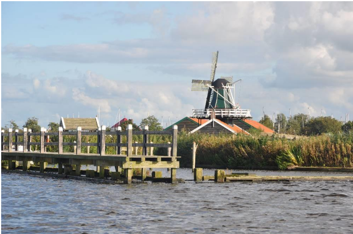
De Lattenzager op Erfgoedpark de Hoop Uitgeest.

Na de droogmaking van de vele meren en meertjes in Noord-Holland boven het IJ verandert er tot de ruilverkaveling van de 20e eeuw weinig tot niets aan het landschap. Aan de bebouwde omgeving des te meer. De watermolen uit de 15e eeuw wordt zodanig aangepast dat de windkracht ook kan worden gebruikt om hout te zagen, oliezaden te pletten, papier te maken, hennep te kloppen om touw van te maken. Het is de start van een ontwikkeling die van de Zaanstreek het eerste industriegebied ter wereld maakt. Langs de Zaan staan dan vele honderden industriemolens, maar ook in de rest van Nederland heeft de industriemolen zijn invloed. De Zaanse Schans met zijn molens en pakhuizen houdt die herinnering levend, met jaarlijks vele bezoekers uit binnen- en buitenland als gevolg.