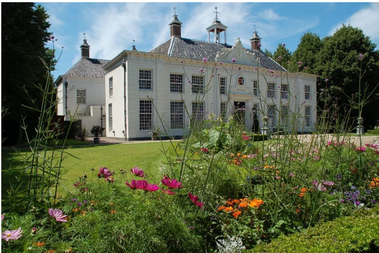
Beeckestijn in Velsen Zuid.

Al die nieuw verworven welvaart moet natuurlijk getoond worden. Rijke kooplieden en industriëlen, vooral uit Amsterdam, maar zeker ook uit de regio, laten weelderige buitenplaatsen in de Oer-IJ regio bouwen. De een nog mooier dan de ander, want je moet natuurlijk je buurman overtreffen. Naast exhibitionisme speelt daarbij ook de hang naar gezondheid een rol. Het leven in stinkende en steeds vollere steden doet verlangen naar schone lucht. Het duingebied met zijn frisse briesjes doet dan wonderen en is daarom zeer populair. Wat ook meehelpt bij de vestiging van buitenplaatsen is de bereikbaarheid over het water vanuit Amsterdam en Haarlem. In het Oer-IJ gebied zijn nog verscheidene fraaie buitenplaatsen te bewonderen.