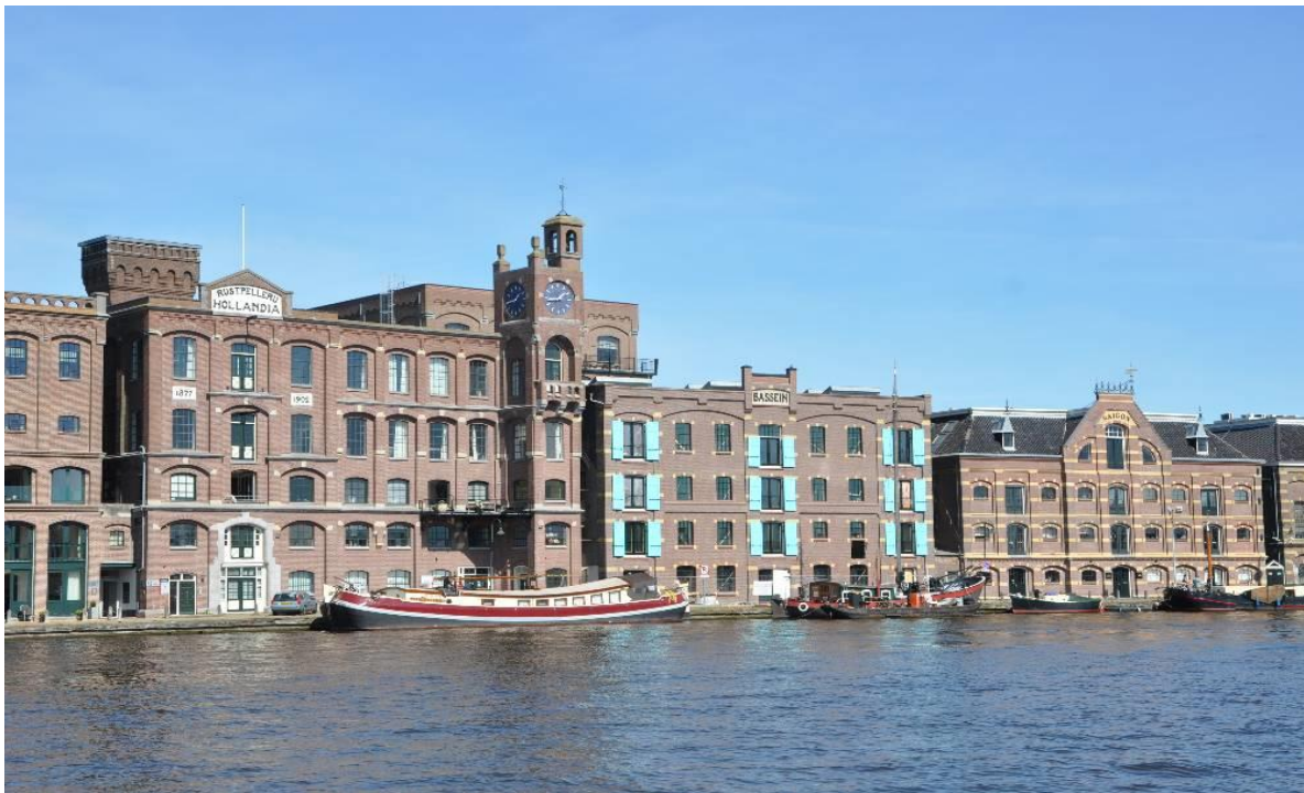
Industrieel monument in Wormerveer langs de Zaan.

Stimuleer dus als gemeente actieve participatie aan Omgevingstafels. Dat niet alleen in de plannenmakerij, maar ook als onderdeel van de vergunningenprocedure. Door al vanaf het eerste begin alle belanghebbenden bij het gesprek te betrekken, ontstaat verbinding tussen de verschillende belangen en vertrouwen tussen de betrokken partijen. Dat heeft als bijkomend voordeel dat in het formele proces snelheid wordt gewonnen.