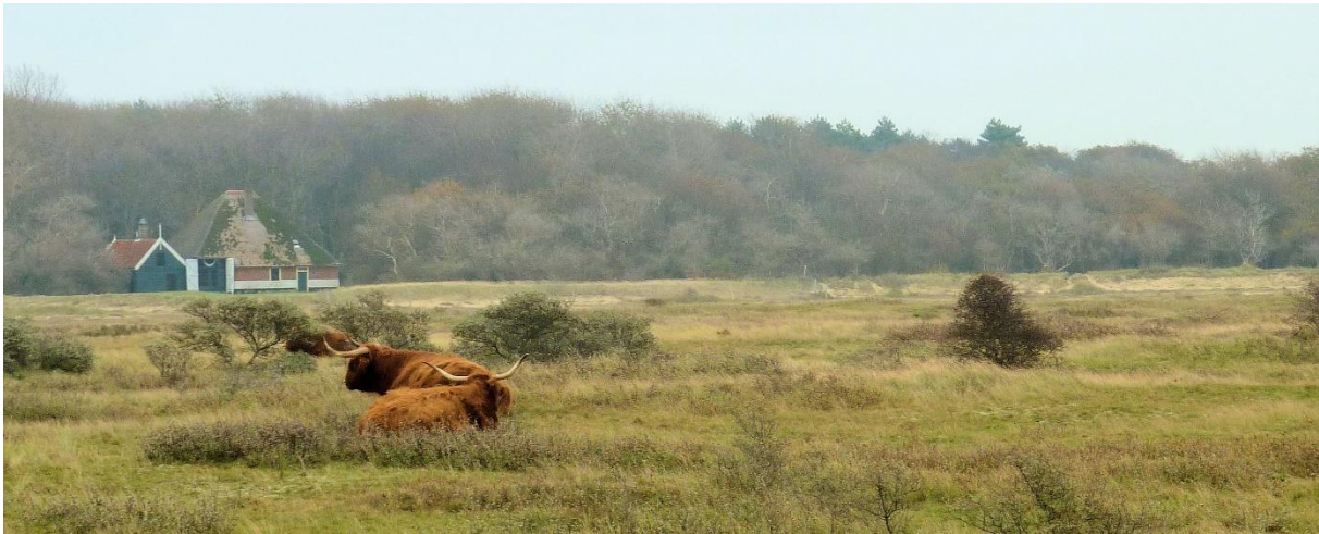
Voormalige duinboerderij

Begin vorige eeuw wordt het duin in het Oer-IJ gebied niet meer gebruikt als landbouwgrond. Wel worden door bewoners van de zeedorpen moestuintjes aangelegd die worden afgegraven tot op het grondwater. Bij Egmond is zo iets nog duidelijk waar te nemen. Dit landschap is met zijn kruidenrijke vegetatie zeer speciaal en wordt beschouwd als een van de meest waardevolle van de Nederlandse duinen. Ook cultuurhistorisch is het van grote waarde.