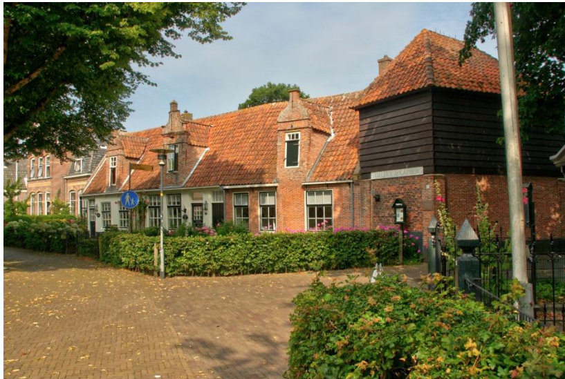
Egmond aan den Hoef.