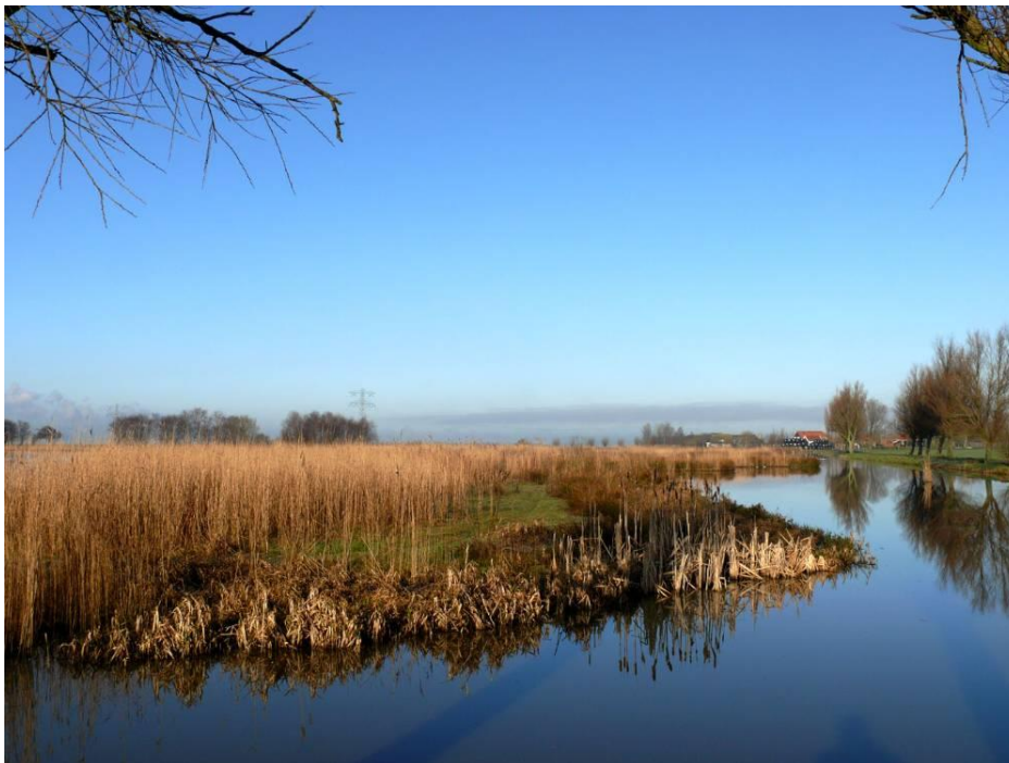
De bedding van de Crommenije

Om de bescherming tegen het water verder te verhogen worden er ook dammen aangelegd in mondingen van veenrivieren. Dat gebeurt bij de Zaan, de Crommenije, de Purmer Ee, de IJ in Zeevang, de Rekere, het Spaarne, de Liede en de Amstel. De dammen worden deels open gehouden, anders zijn afwatering en scheepvaart onmogelijk. Het is trouwens hierbij steeds een strijd tussen deelbelangen. Zelfs keizer Karel V heeft zich er af en toe tegenaan bemoeid. Uiteindelijk worden de gaten in de dammen vervangen door sluizen, spuisluisen voor het afwateren en schutsluisen voor de boten. Daardoor blijft bescherming bij hoogwater mogelijk, maar is er toch ook ruimte voor afwatering en scheepvaart.