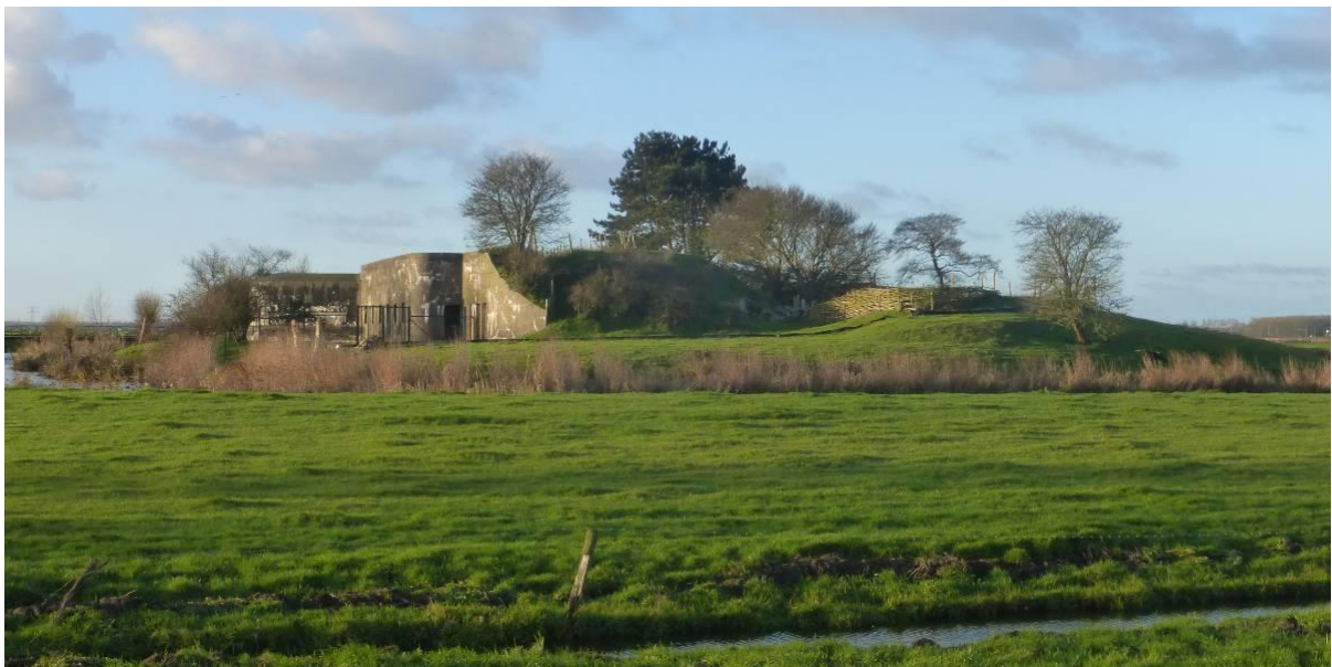
Fort bij Krommeniedijk, foto Lia Vriend

Waarschijnlijk het bekendste voorbeeld van militaire werken in de regio is de Stelling van Amsterdam. Deze combinatie van forten met daartussen door mensenhand te vullen waterlinies rondom de hoofdstad is aangelegd tussen 1880 en 1914. Dit unieke verdedigingswerk van 135 kilometer lengte is nooit gebruikt, maar is inmiddels wel bestempeld tot Unesco-Werelderfgoed.