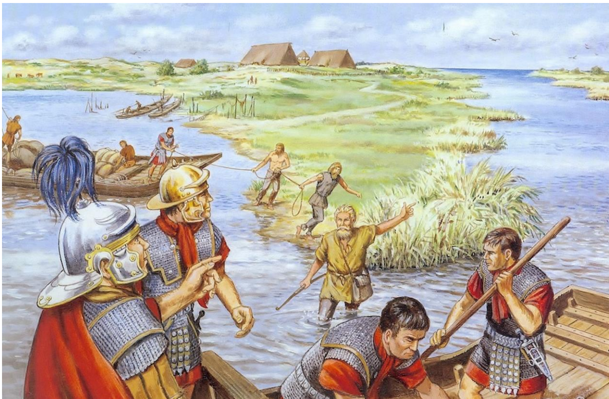
Ontmoeting van Romeinen met Friezen. Tekening: Bert Bus.

'Een miserabel ras' noemt de Romeinse legercommandant Plinius het volk waarop hij en zijn troepen in het begin van onze jaartelling stuiten. Hier, aan de boorden van de Noordzee, bevindt zich het land van de Friezen. De kosmopolitische Romeinen kijken met enig dedain neer op deze bewoners van zandbanken, strandwallen en veengebieden in het noorden en westen van Holland. Plinius, later bekend geworden als geschiedschrijver, kan er niet over uit. Dat volk woont op "met de hand opgehoogde stukken grond... Rondom hun hutten jagen ze op vissen die met het aflopende water proberen te ontsnappen... Het is maar al te waar: Het lot spaart de mens om ze te straffen."