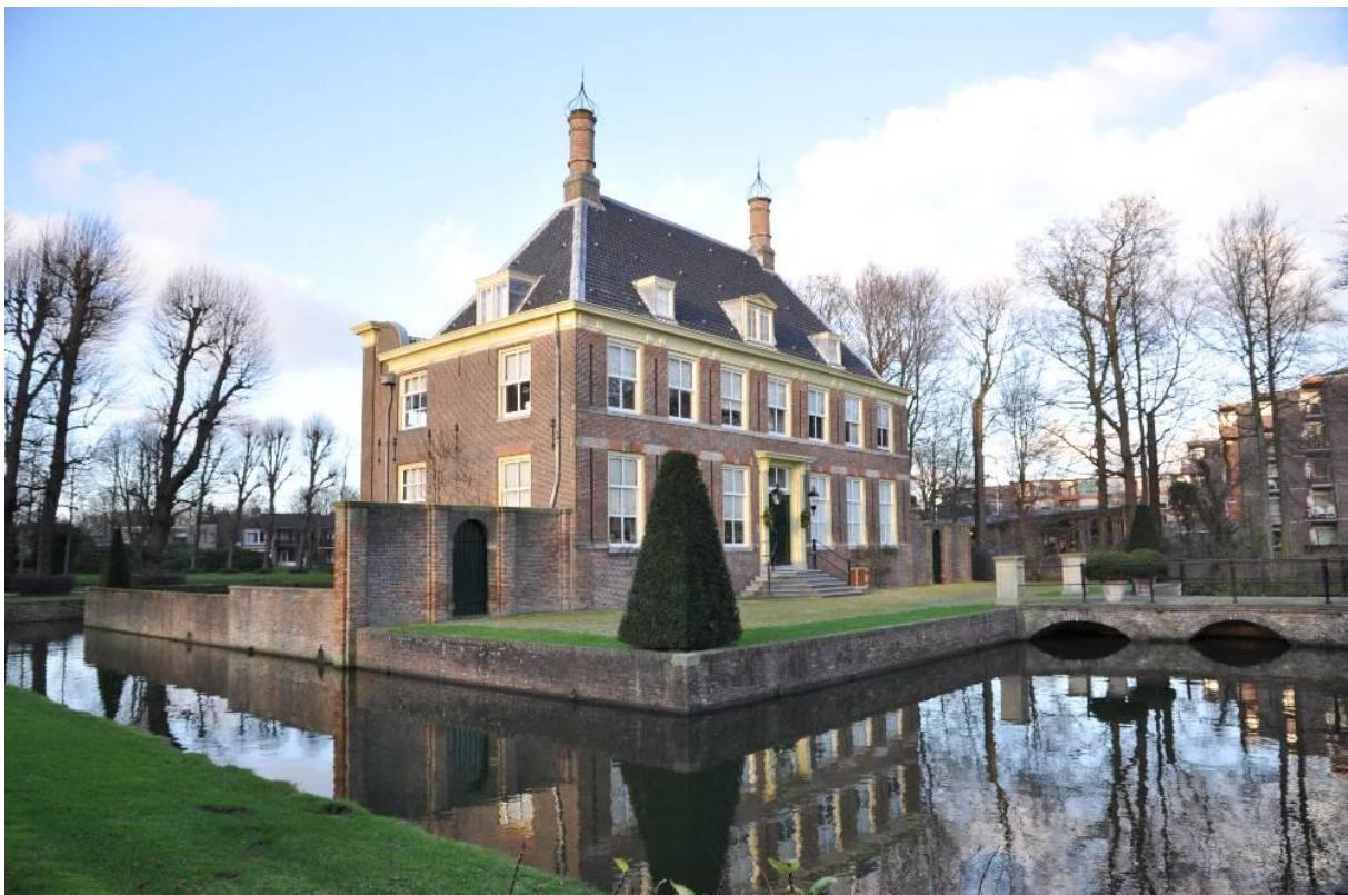
Buitenplaats Akerendam te Beverwijk.

De oplevering van het Noordzeekanaal in 1876 heeft het karakter van Midden-Kennemerland totaal veranderd. Waar nu de zware industrie huist bij Velsen en Beverwijk, stonden