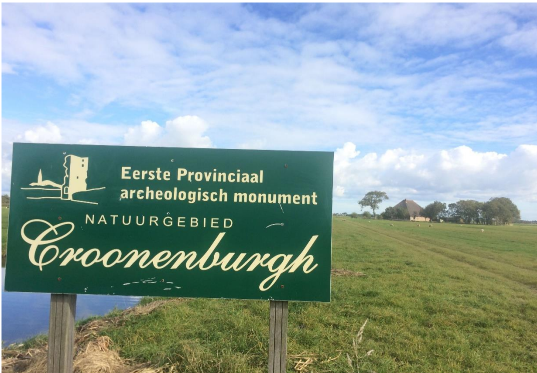
Archeologisch monument Croonenburgh bij Castricum.

Als er vragen zijn of ondersteuning gewenst is op archeologisch gebied, dan is de aangewezen partij NMF Erfgoedadvies, gevestigd in Castricum.