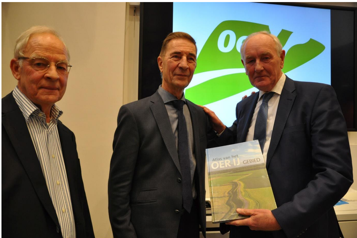
Overhandiging van het eerste exemplaar van de Oer-IJ Atlas aan Johan Remkes, Voormalig Commissaris van de Koning.

Een cultuurhistorische waardestelling geeft erfgoed betekenis zodat we het kunnen identificeren en (h)erkennen. Waarderen is een werkwijze om weloverwogen met dit erfgoed om te gaan. Door de waarde expliciet te maken, kunnen we samen een keuze maken in wat we willen behouden. Waarde is een van de belangrijkste begrippen in de zorg voor het erfgoed. Wat als waardevol wordt gezien, zal (her)gebruikt, behouden of gekoesterd worden. Zo ondersteunt een cultuurhistorische waardebepaling overheden of collectie behorende instellingen bij de uitvoering van hun taken. Bijvoorbeeld bij de aanpassing van een raadhuis, de realisatie van een parkeerkelder in een oude binnenstad, de restauratie van een schilderij of het onderhoud van een historische tuin.