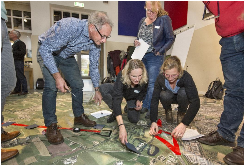
Brainstormdag met ambtenaren over toekomst Oer-IJ gebied.

Die snelle groei van het toerisme maakt politieke en bestuurlijke aandacht ervoor erg nodig.