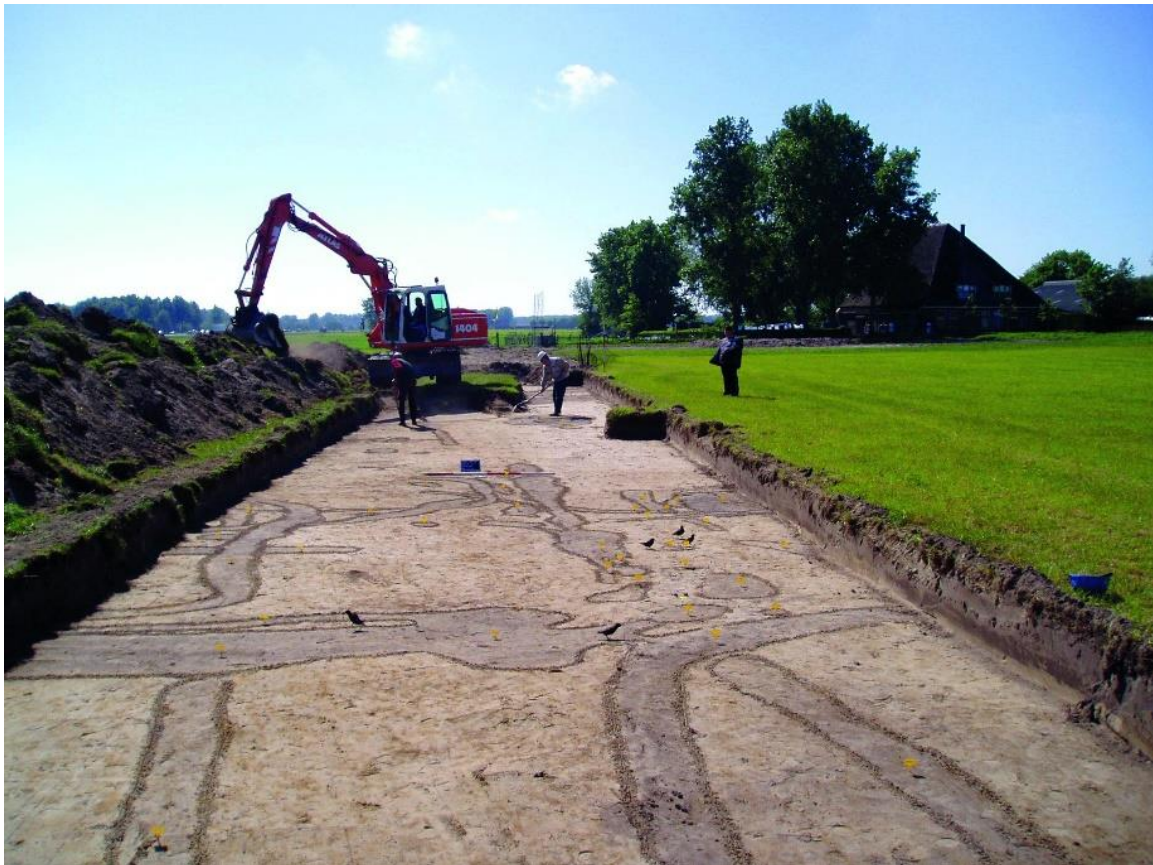
Archeologische opgravingen Limmen - De Krocht.

Soms is ook het doorzettingsvermogen van amateurs van groot belang. Dat geldt niet alleen voor het onderzoek bij Limmen-De Krocht. Een ander mooi voorbeeld daarvan is de ontdekking van kasteel 't Blockhuijs aan de zuidkant van Castricum. Na jarenlang archiefonderzoek door een amateurhistoricus worden er aanwijzingen gevonden voor een woonhuis dat ergens in de 14e eeuw aan de zuidkant van Castricum is gelegen. Bij nader archeologisch onderzoek worden die aanwijzingen alleen maar sterker. Uiteindelijk laat de gemeente grondonderzoek doen en worden er inderdaad sporen ontdekt van een fors woonhuis met een gracht er omheen. Een kasteel dus. De gracht wordt gevoed met water uit een oude Oer-IJ geul. Een echt Oer-IJ kasteel dus, aldus de trotse ontdekker.