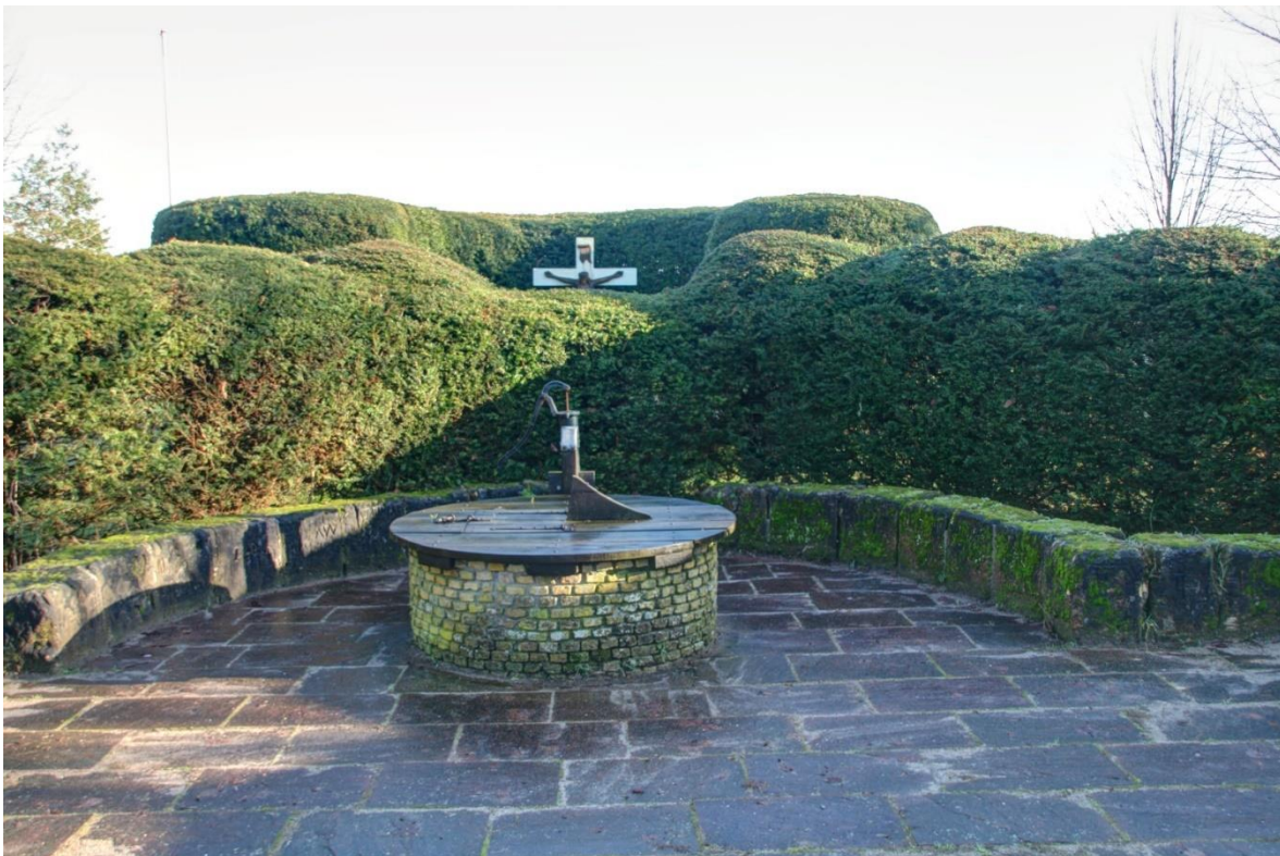
Adelbertusput, nabij Egmond Binnen.

Nieuwe landbouwgrond brengt nieuwe welvaart in de regio. Dat ontgaat ook de adel niet. De graven van Holland laten er een slot bouwen en Egmond groeit uit tot een bestuurlijk centrum. Dirk I, een van de eerste graven van Holland, ligt bij de abdij begraven. De kerkelijke macht is dan al enigszins gevestigd. De abdij is niet alleen grootgrondbezitter, maar vergeet ook haar religieuze missie niet. Daarbij gaan de monniken slim te werk. Ze