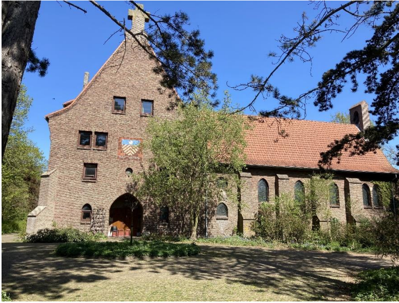
Abdy van Egmond.

Als cultuur wordt gezien als dat wat de mens toevoegt aan zijn nog ongerepte natuurlijke omgeving dan gaat het met name om de vaststelling van bewoning. Die wordt in het Oer-IJ gebied steeds meer mogelijk door de vorming van strandwallen en de dichtslibbende riviermonding alsmede de opgeworpen veenheuvels. De dreiging van het water vermindert daardoor aanzienlijk. Dat maakt niet alleen bewoning, maar ook ontginning en bewerking van het land voor voedselproductie haalbaar.