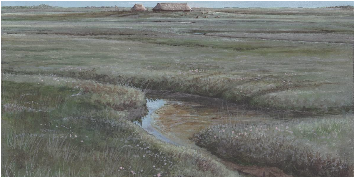
Impressie van het kwelderlandschap omstreeks 2000 v. Chr. Afbeelding Rob van Eerden.

De term is al een paar keer gevallen, maar wat is dat precies, het Oer-IJ? Het is een jonge term voor een oud en al grotendeels verdwenen landschap in de driehoek tussen Velsen, Alkmaar en Zaanstad. Het begrip Oer-IJ wordt pas in 1951 gemunt door de Turkse geoloog Ali Riza Güray die dan onderzoek doet naar de bodemgesteldheid van de IJ-polders. Het IJ duidt op water zoals dat nu nog door Amsterdam stroomt en lang geleden ook deel uitmaakte van een omvangrijk getijdengebied. Het Oer-IJ is zo'n 5000 jaar geleden gevormd en was toen de meest noordelijke monding van de Rijn in Holland. Deze monding ontstaat als het grote getijdenbekken aan de toenmalige Noord-Hollandse kust dichtslibt. Wat rest zijn twee zeegaten die nog zorgen voor de afwatering van de lokale rivieren. Het Zeegat van Bergen en zuidelijk daarvan het Oer-IJ dat bij Velsen in zee stroomt. De zee blijft continu zand aanvoeren en werpt daarmee strandwallen op die uiteindelijk het zeegat bij Bergen doen verdwijnen, in 1400 v. Chr. De rivieren die dit zeegat tot dan toe benutten voor afwatering doen dat voortaan meer oostelijk, via de Flevomeren die door stormen en/of bodemverzakking een verbinding krijgen met de Waddenzee. Het Oer-IJ is de laatste die standhoudt, maar ook hier zal de Noordzee zijn nimmer aflatende werk doen.