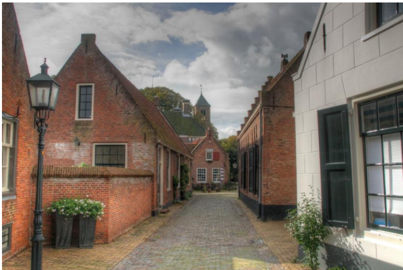
Velsen Zuid.

Al in de 8e eeuw stichtte Willibrord daar een kerk waar omheen wat huizen stonden. Overstromingen nopen de bewoners te verkassen, maar in de 12e eeuw wordt een nieuwe kerk met wat bebouwing er omheen gesticht, voornamelijk bedoeld voor de landbouwers en