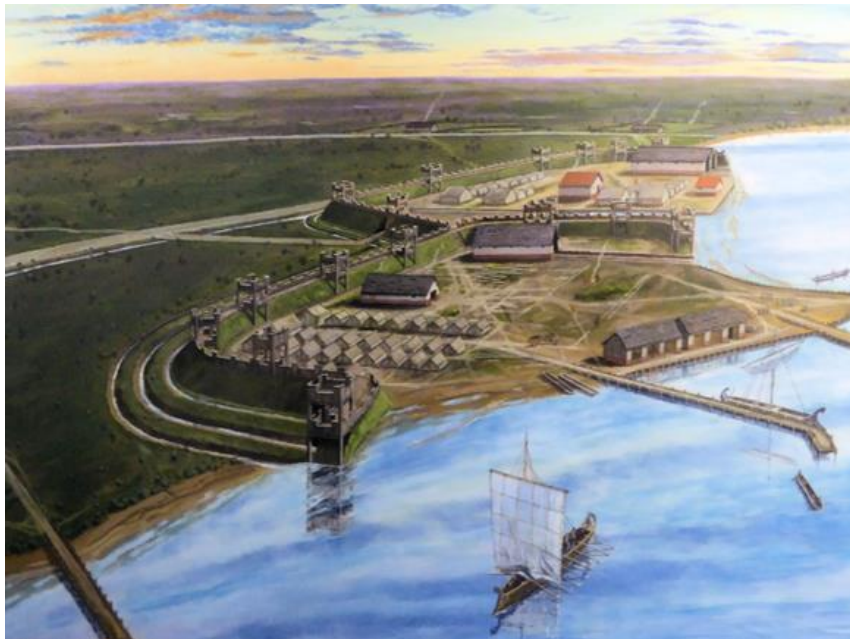
Impressie van Velsen II. G. Sumner

Hoewel de Romeinen het schrift meebrengen naar het Oer-IJ gebied, en daarmee een einde maken aan de prehistorie aldaar, is er geen document waaruit blijkt waarom zij aan het Oer-IJ een fort hebben gebouwd. Willen zij de bewoners van het Oer-IJ gebied, door hen Friisi genoemd, onderwerpen en door machtsvertoon eventueel verzet al bij voorbaat de kop indrukken? Het zou kunnen. Velsen I ligt enkele kilometers van een inheems heiligdom. Dat